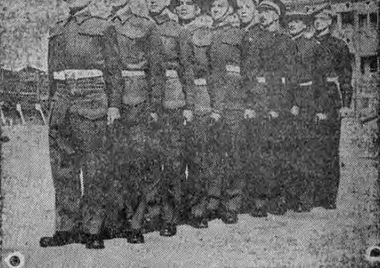
Siete países de los que forman el imperio británico están representados en este grupo de cadetes de una unidad de entrenamiento en el Cabo, Escocia, Gambia, Sur Africa, Nueva Zelandia, Australia, Inglaterra, Rhodesia, se ven en esta foto por su orden.

De parte del cortésismo se sabe que los ánimos están exaltados y que, algunos de los dirigentes de dicha agrupación, han declarado que ellos desfilan el domingo en San Rafael de Heredia, sujeta a lo que suceda. Por su parte, el ejecutivo está obligado a mantener su disposición que, de acuerdo con la ley, prohíbe terminantemente los desfiles y manifestaciones políticas cuando lleve a dicha población.